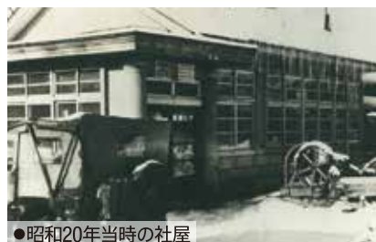
●昭和20年当時の社屋