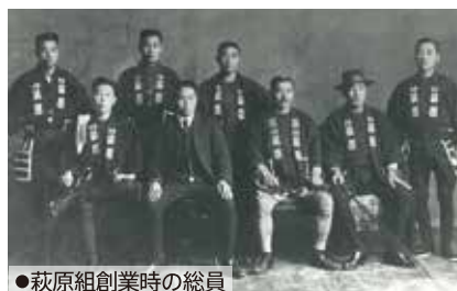
●萩原組創業時の総員