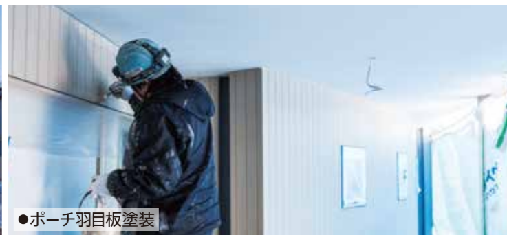
●ポーチ羽目板塗装