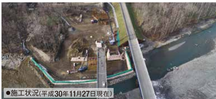
●施工状況(平成30年11月27日現在)