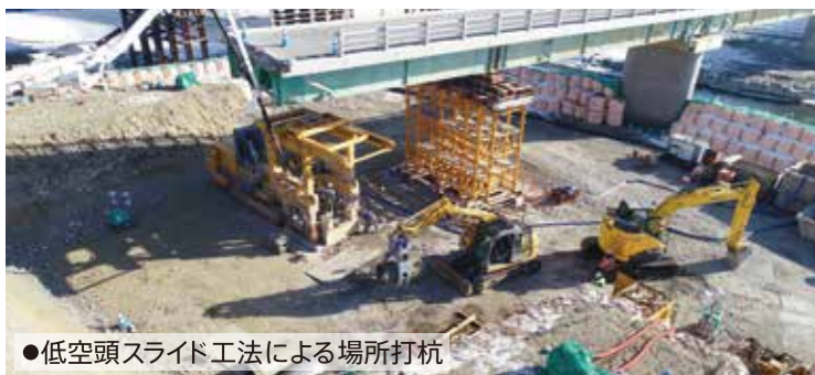
●低空頭スライド工法による場所打杭