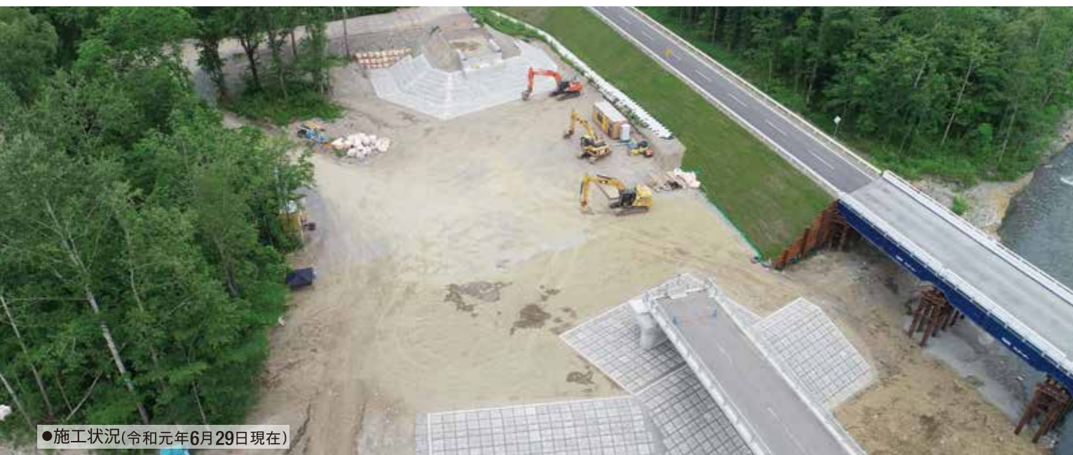
●施工状況(令和元年6月29日現在)