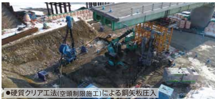
●硬質クリア工法(空頭制限施工)による鋼矢板圧入