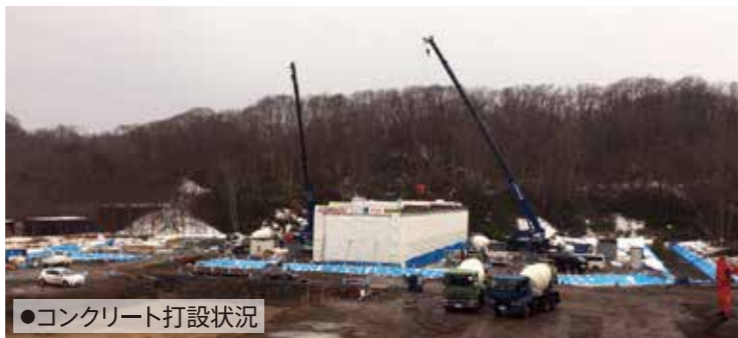
●コンクリート打設状況