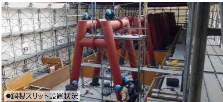
●鋼製スリット設置状況