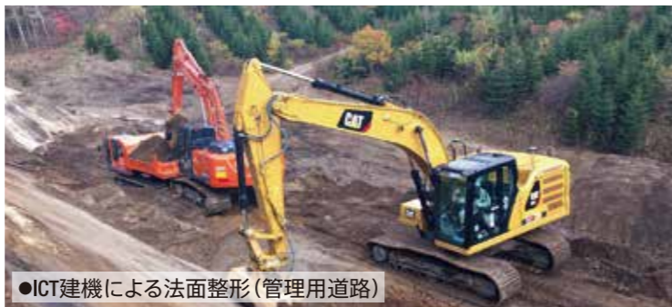
●ICT建機による法面整形(管理用道路)