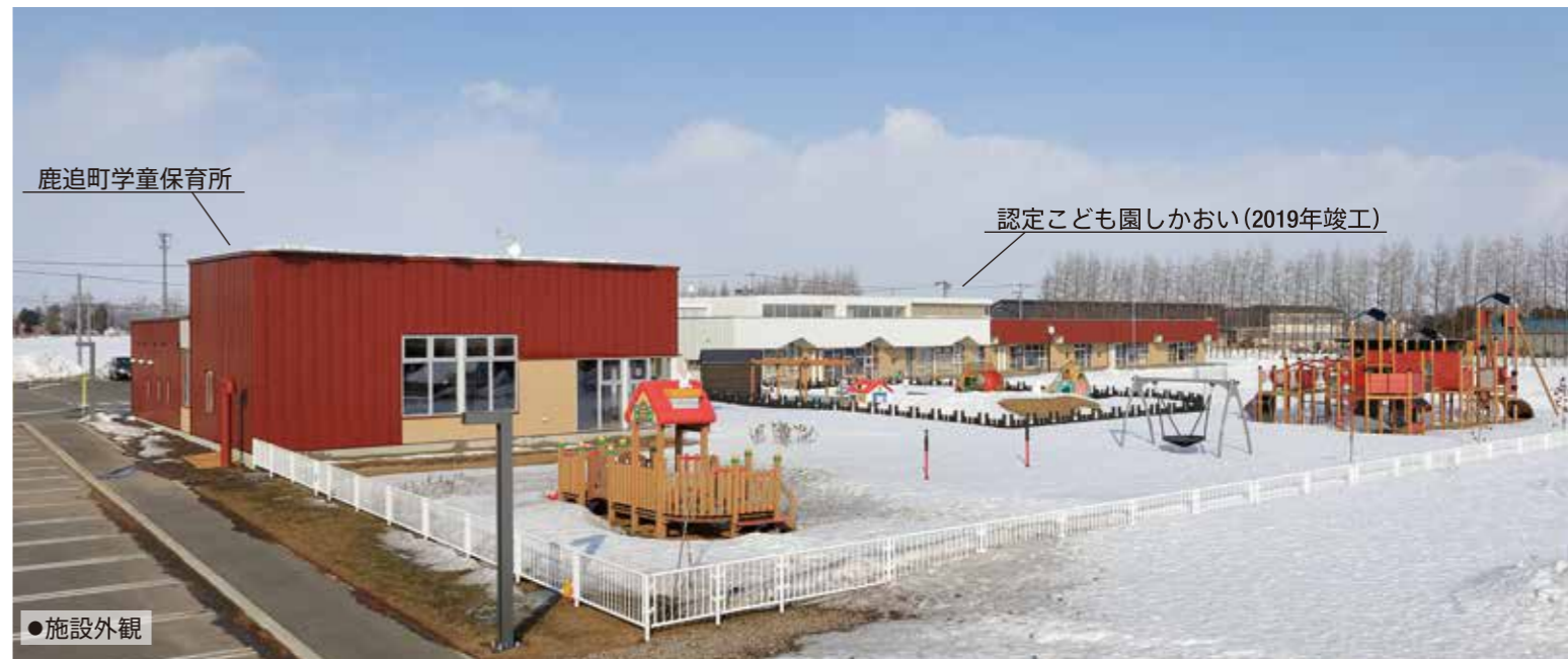
鹿追町学童保育所