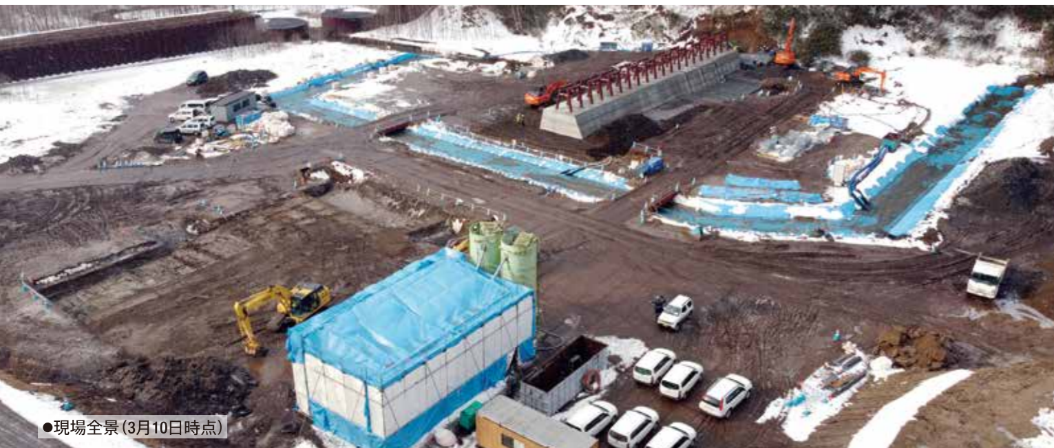
●現場全景(3月10日時点)