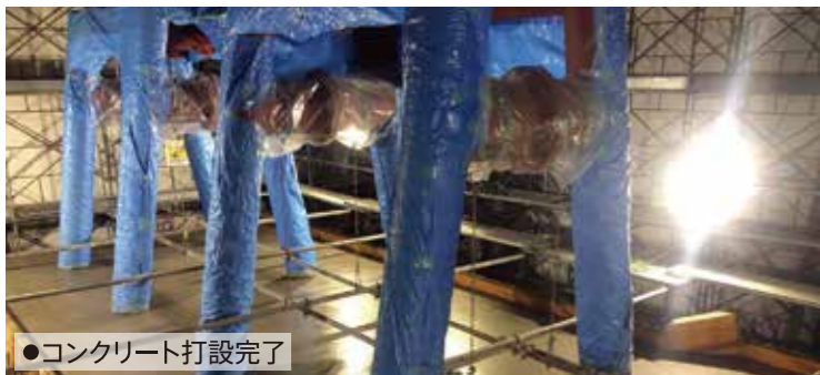
●コンクリート打設完了