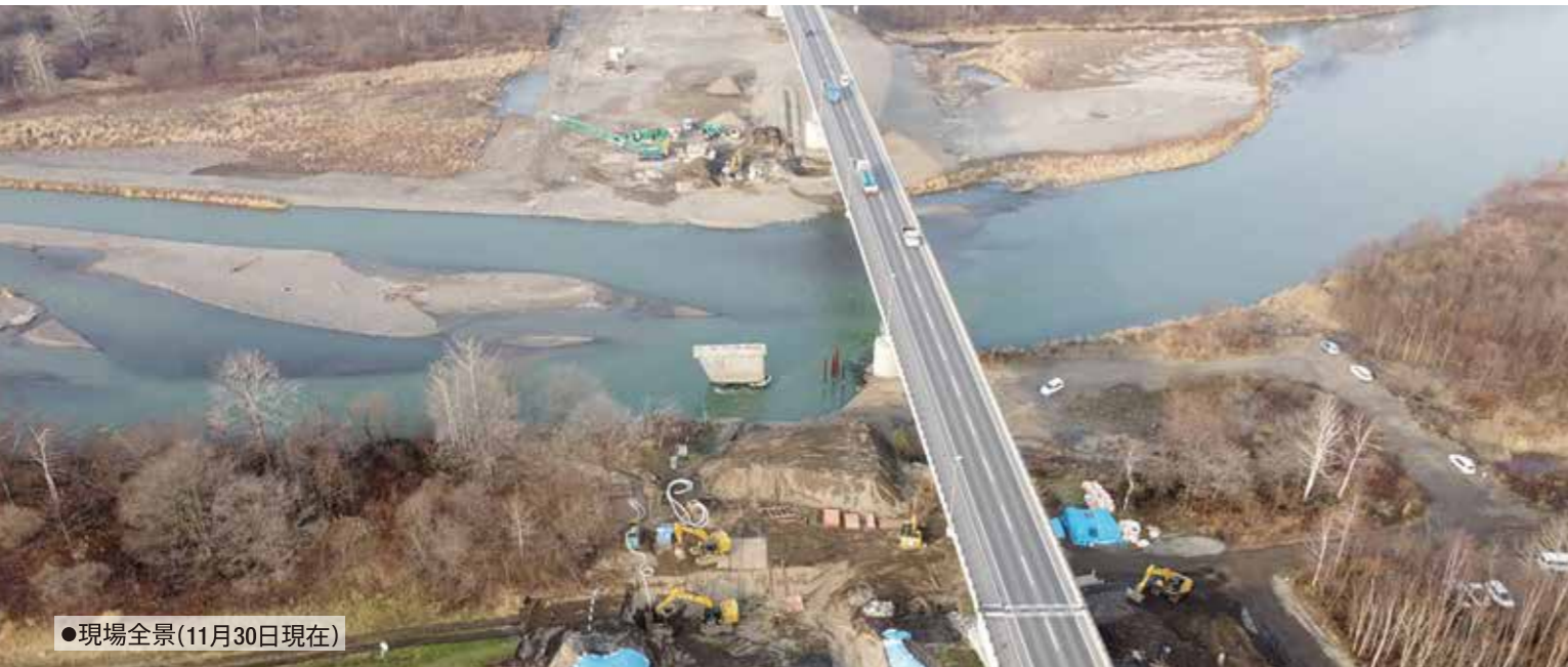
●現場全景(11月30日現在)