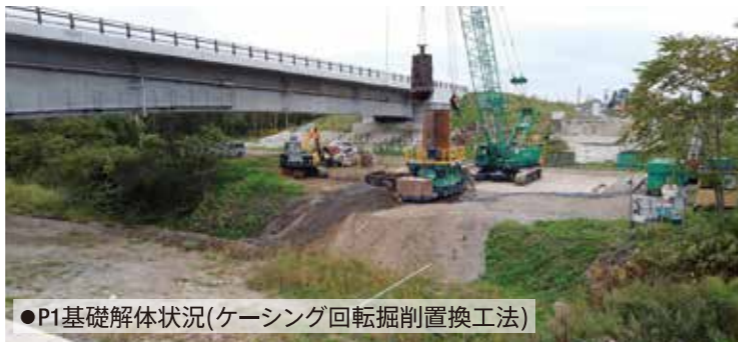
●P1基礎解体状況(ケーシング回転掘削置換工法)