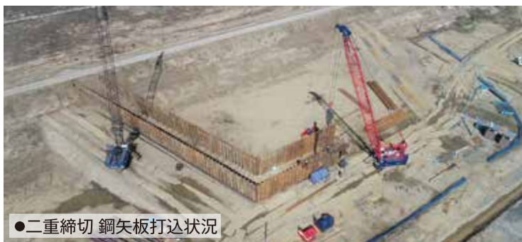
●二重締切 鋼矢板打込状況