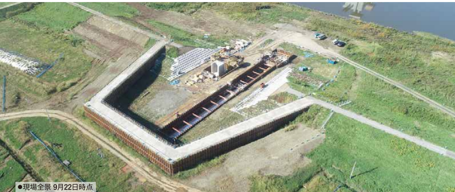
●現場全景 9月22日時点