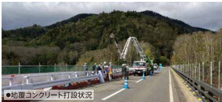
●地覆コンクリート打設状況