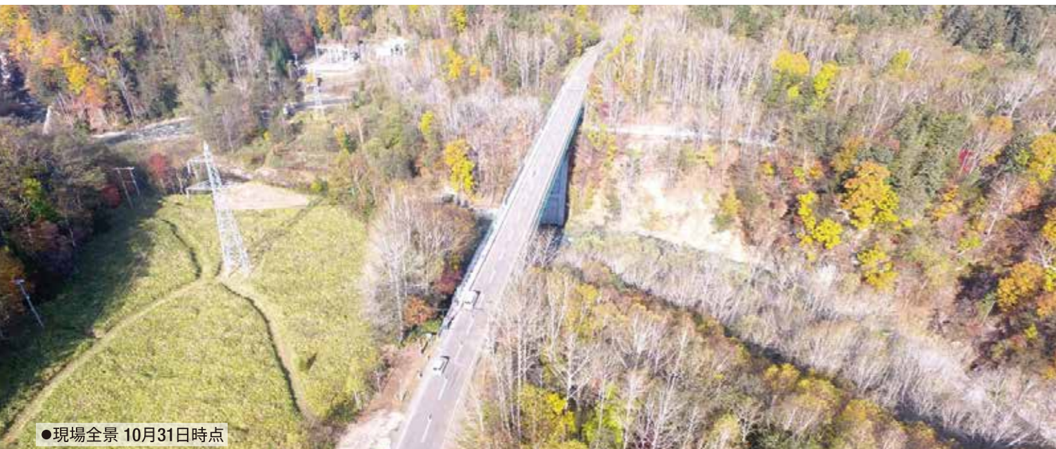
●現場全景 10月31日時点