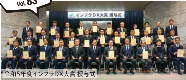
令和5年度インフラDX大賞 授与式