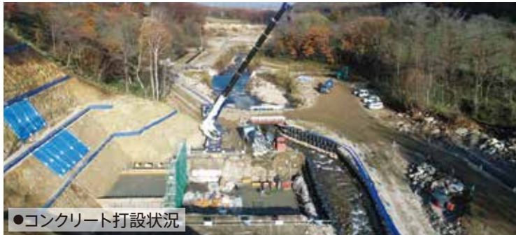
●コンクリート打設状況