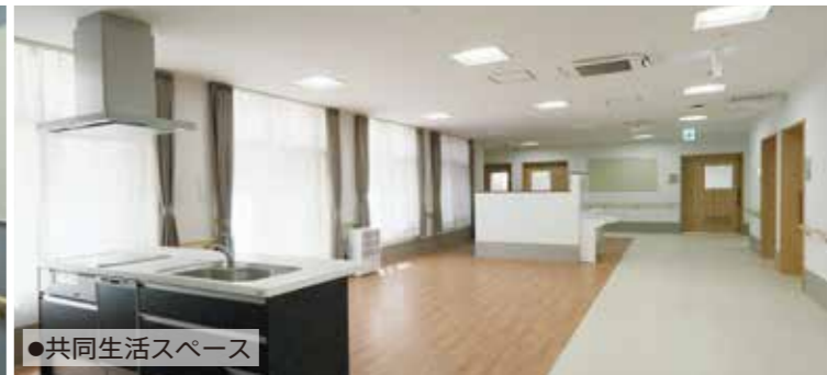
●共同生活スペース