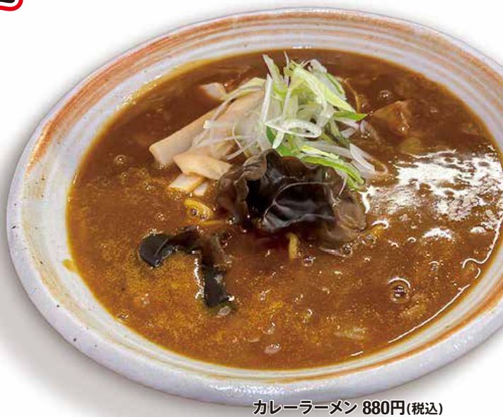
カレーラーメン 880円(税込)

ゼネコンの営業マンとして津々浦々、数々のラーメンを経験。ラーメンへのこだわりは社内イチ。