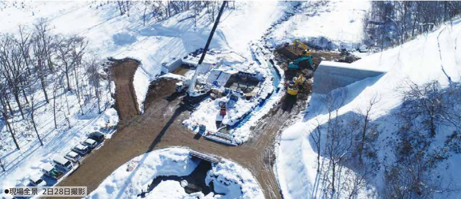
●現場全景 2日28日撮影