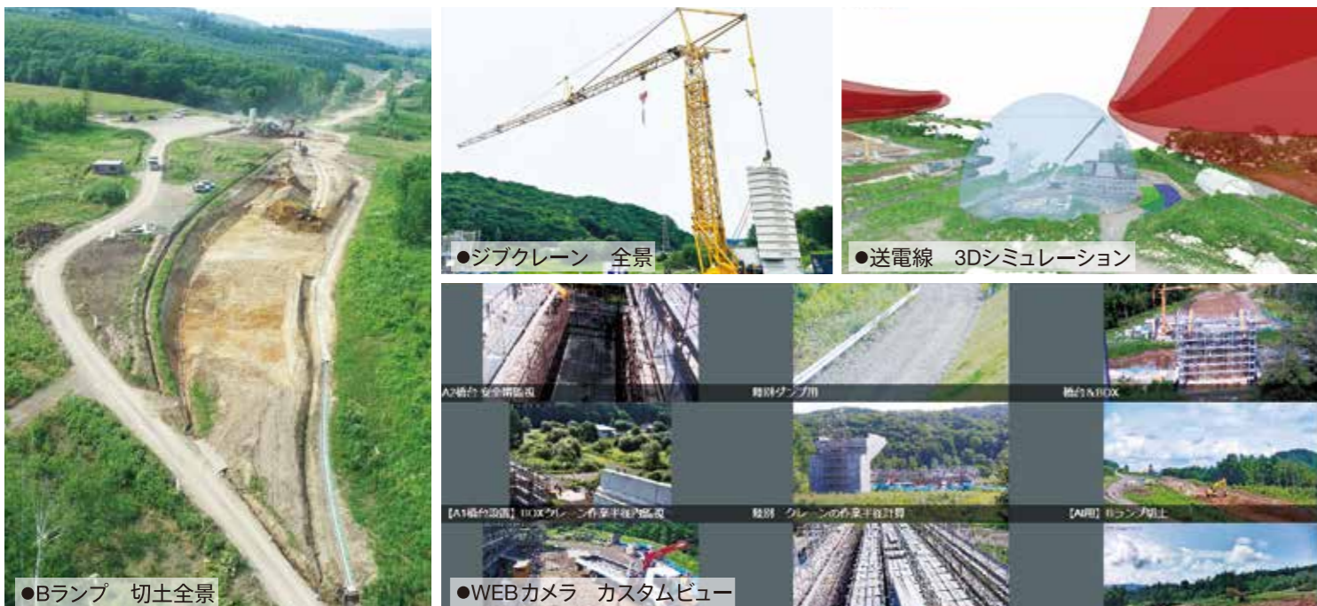
●ジブクレーン 全景