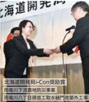
北海道開発局i-Con奨励賞 雨竜川下流農地防災事業 雨竜川八丁目頭首工取水樋門改築外工事