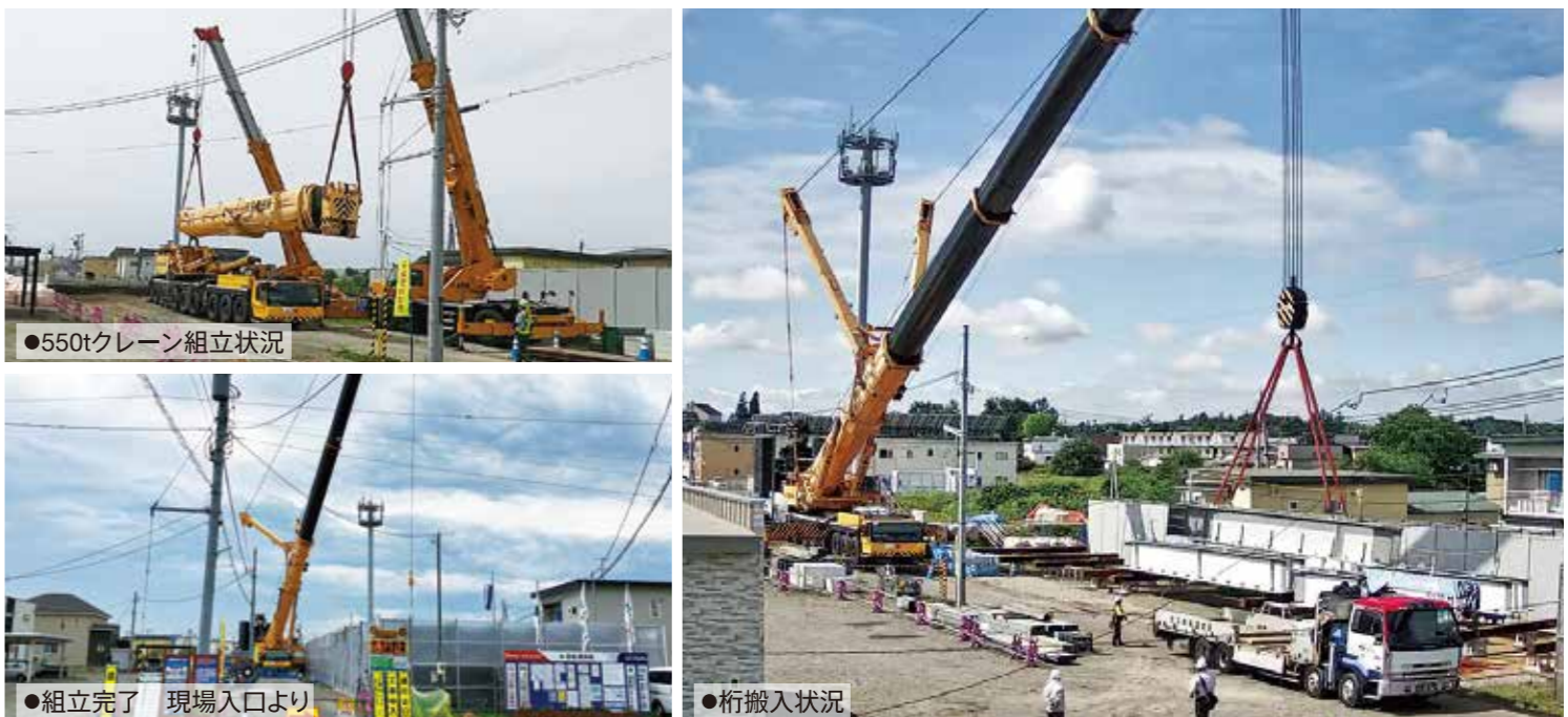
●550tクレーン組立状況