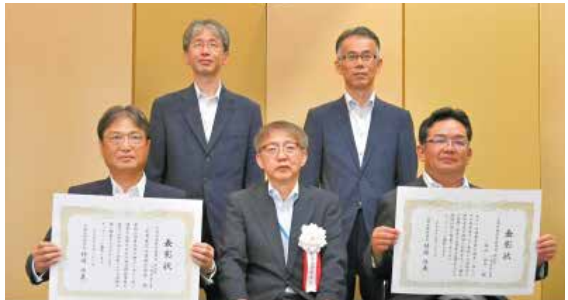
令和5年度北海道開発局優良工事等表彰式