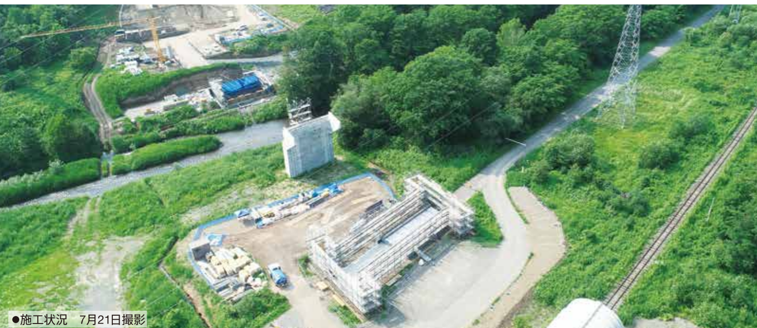
●施工状況 7月21日撮影