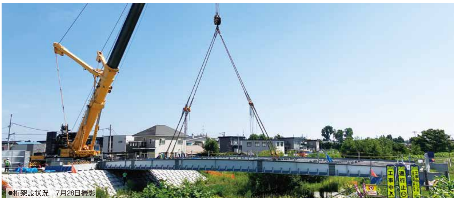
●桁架設状況 7月28日撮影