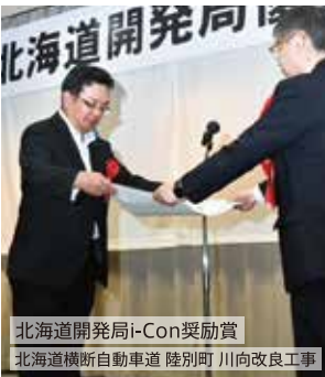
北海道開発局i-Con奨励賞 北海道横断自動車道 陸別町 川向改良工事