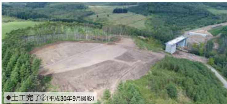
●土工完了②(平成30年9月撮影)