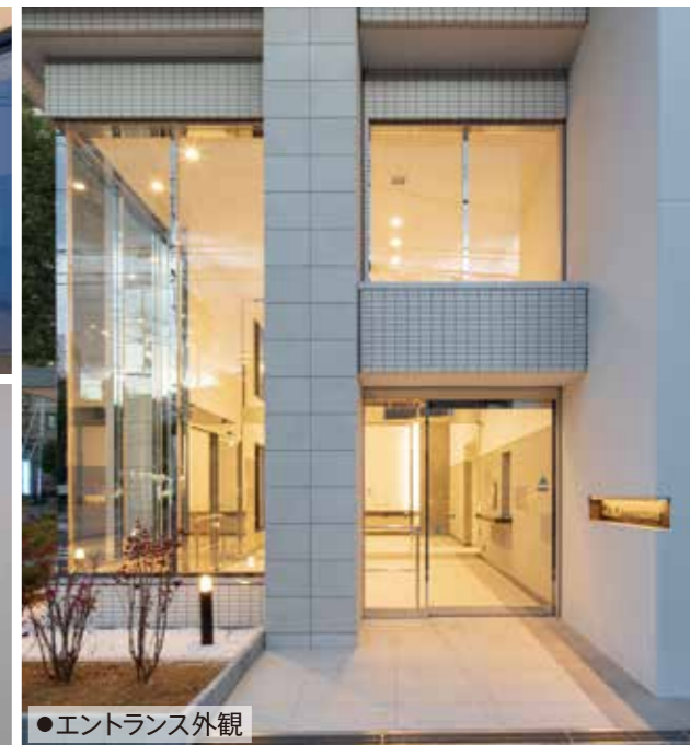
●エントランス外観