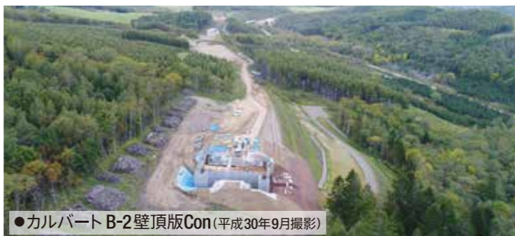
●カルバート B-2 壁頂版Con(平成30年9月撮影)