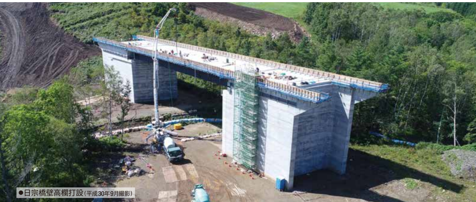
●日宗橋壁高欄打設(平成30年9月撮影)