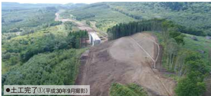
●土工完了①(平成30年9月撮影)