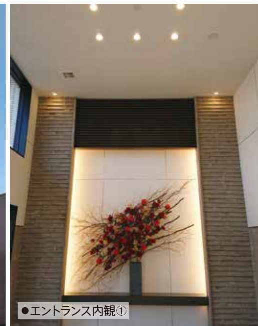
●エントランス内観①