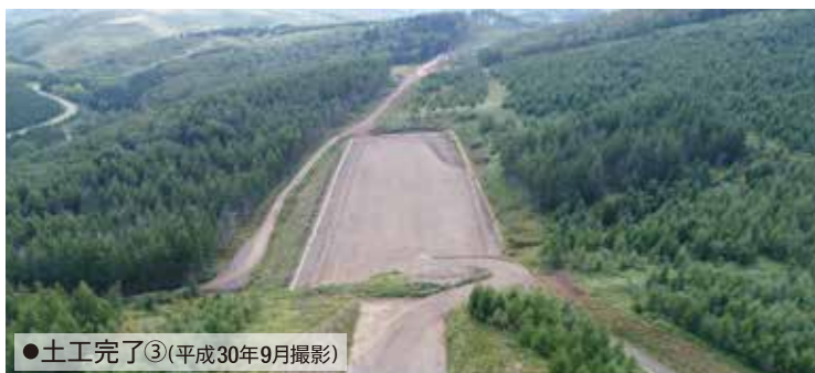
●土工完了③(平成30年9月撮影)