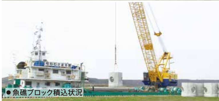
●魚礁ブロック積込状況