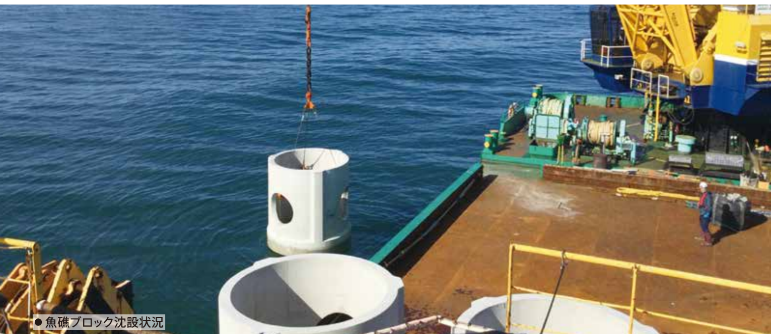
●魚礁ブロック沈設状況