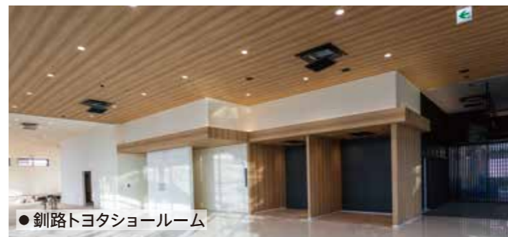
●釧路トヨタショールーム