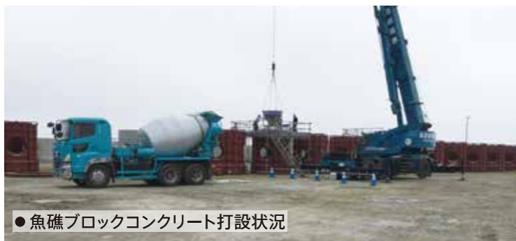
●魚礁ブロックコンクリート打設状況