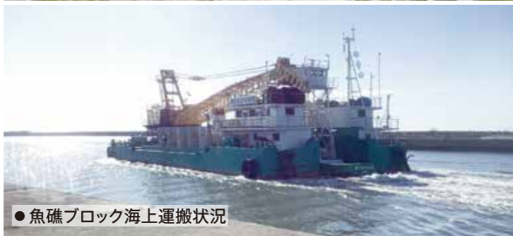
●魚礁ブロック海上運搬状況